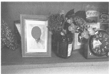
▲居室の棚に飾られた家族の写真と花